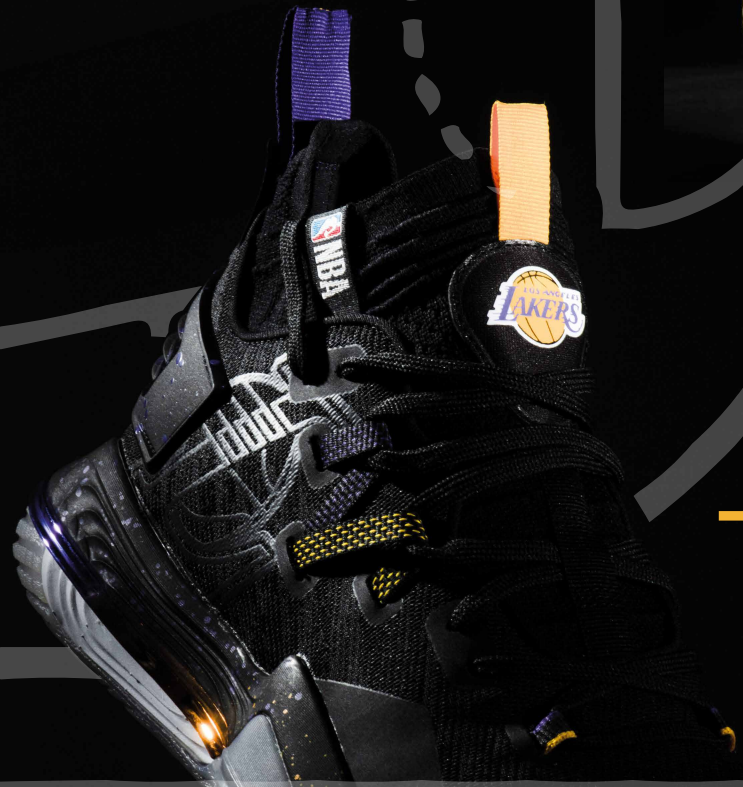
ZAPATILLAS TARMAK ELEVATE 900 LAKERS