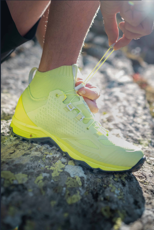
Zapatillas de senderismo rápido FH900 (hombre/mujer)

La gama de productos de Fast Hiking de Quechua se caracteriza por su peso ultra ligero y unas características deportivas de alta tecnología, combinadas con una estética aerodinámica.