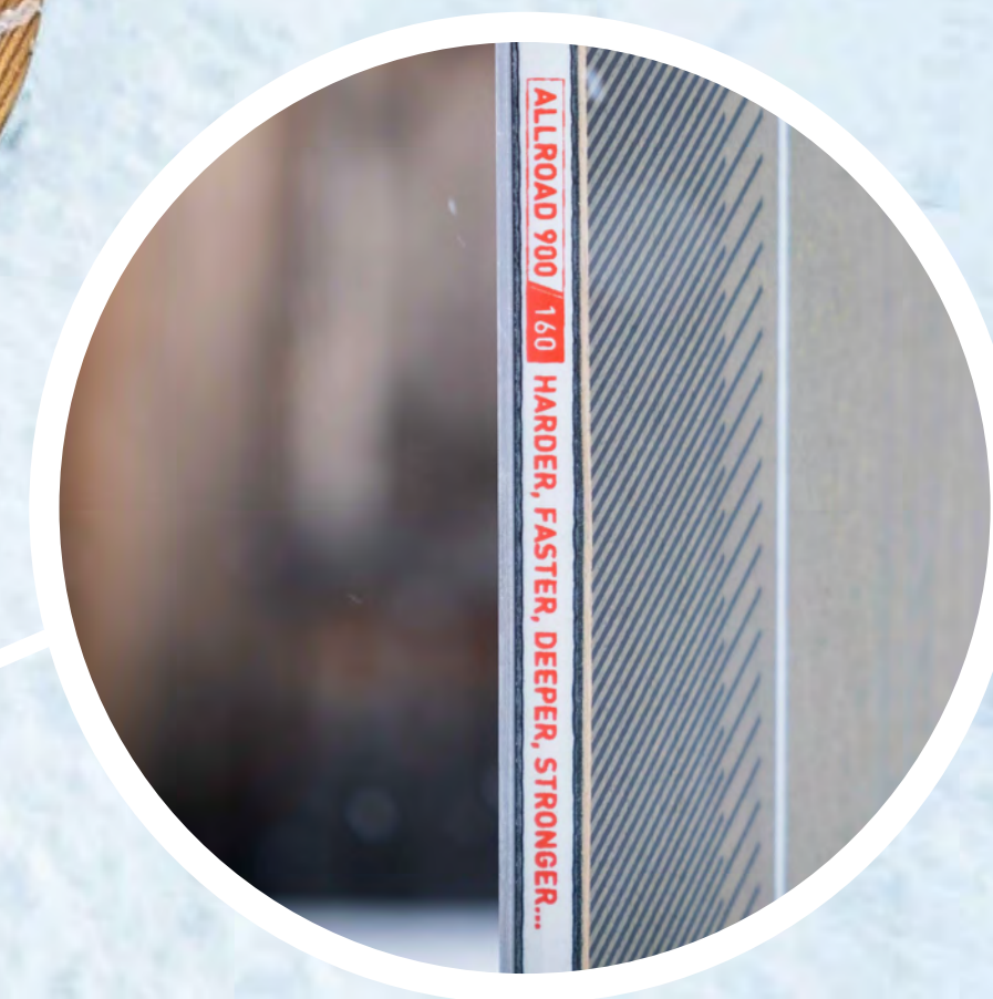
TABLA SNOWBOARD ALL ROAD 900

Este nuevo modelo se ha concebido tras la prueba y escucha de los diferentes test, logrando una tabla de snowboard ideal para carrear y alcanzar grandes resultados también fuera de pista. Con un diseño muy especial, el TopSheet está fabricado en madera de fresno por lo que nunca habrá dos tablas iguales al cambiar siempre la veta de la madera.