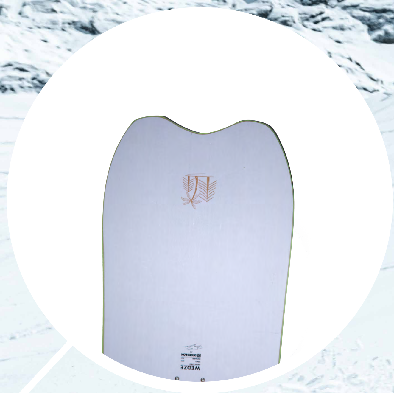
TABLA SNOWBOARD LANDSCAPE

Se trata de la primera tabla de experto de Wedze para el usuario de freeride y nieve polvo en la práctica de snowboard con shape fish. Esta forma, permite maniobrar mejor en los giros teniendo un funcionamiento similar a las quillas de una tabla de surf.